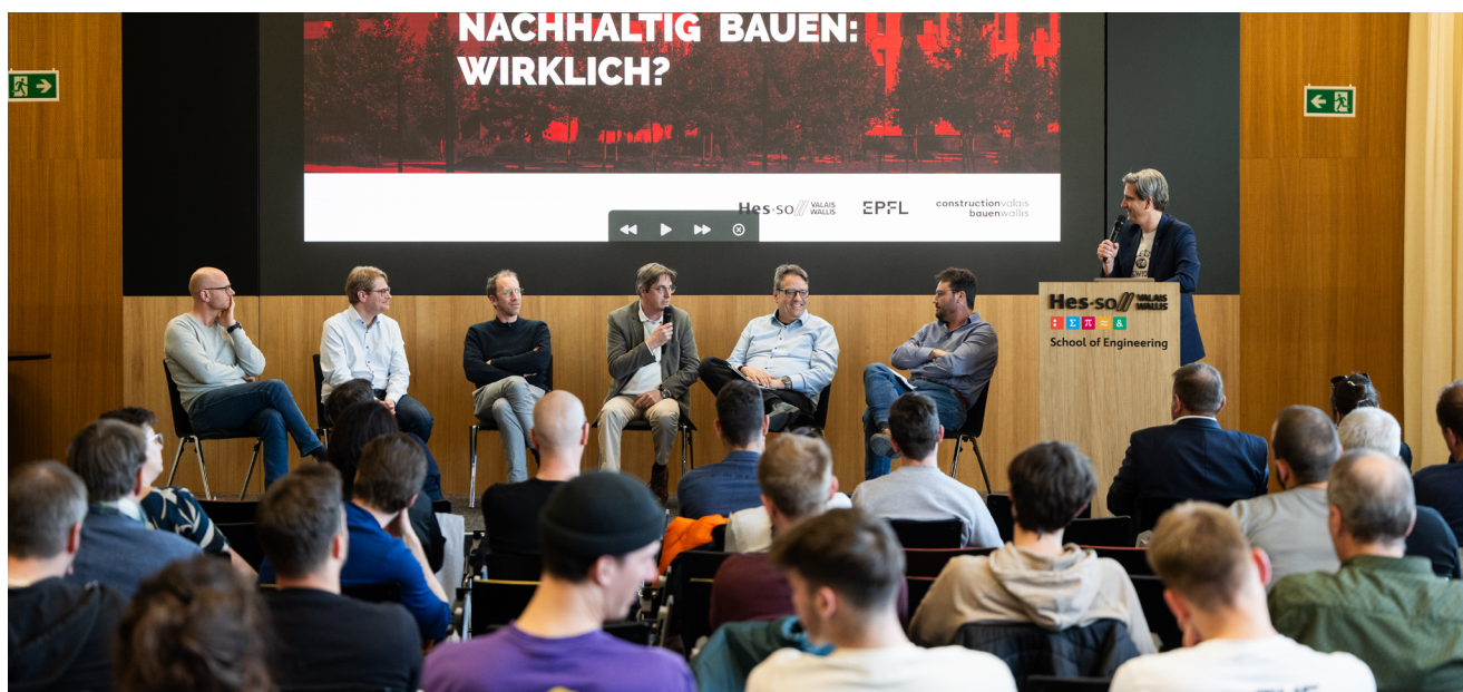
Séminaire 2025 constructionvalais/HES-SO Valais Wallis, Sion, 01.05.2025

Malgré la qualité de l'offre proposée, le comité a souhaité se distancier du Festival Transition. En effet, les membres invités ne se retrouvent pas forcément dans le concept global et constructionvalais, bien décidée à poursuivre l'organisation de ce genre d'évènement, a repris contact avec les écoles et instituts concernés. Le séminaire 2026 est d'ores et déjà prévu le 19 novembre prochain, précédant de peu la journée porte ouvertes de la HES-SO Valais-Wallis et de son institut d'ingénierie prévue le 21 novembre 2026.